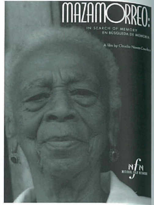
LE DOCUMENTAIRE MAZAMORREO : IN SEARCH OF MEMORY, FILMÉ DANS LA RÉGION DU PACIFIQUE COLOMBIEN

Terra Incognita : La traversée vers une terre inconnue est une installation multimédia qui invite à la découverte d'un fait historique (l'esclavage en Colombie) à travers un parcours sensoriel. Je me servirai des rushes du tournage de mon documentaire Mazamorreo : In Search of Memory , filmé dans la région du pacifique colombien entre 1998 et 2000 pour les différents écrans ainsi que pour la réalisation des nouvelles créations pour les nouveaux montages. Des pièces sonores qui capteront la réalité des lieux ainsi que les états sensoriels des vécus dans chacune des phases seront réalisées, aussi. Chaque phase aura une physionomie différente, pour définir chaque étape de la traversée.